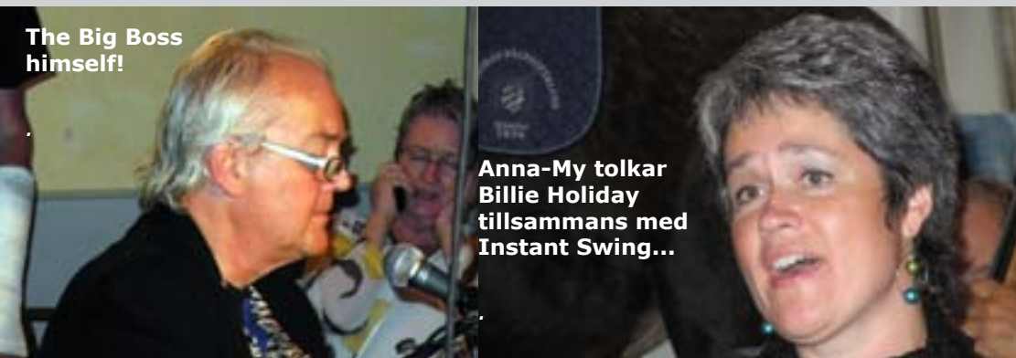
The Big Boss himself!