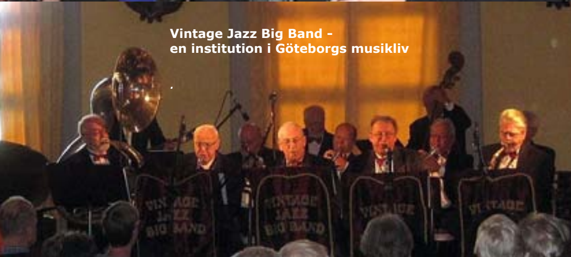
Vintage Jazz Big Band - en institution i Göteborgs musikliv