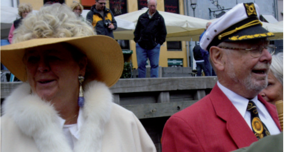
Festivaldronningen med adjutant