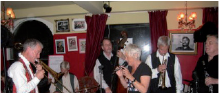
Vår medarbetare hottar till det med Jazzin Jacks